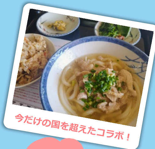
今だけの国を超えたコラボ!